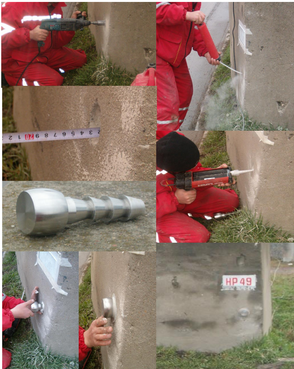
Фигура 4. Етапи от стабилизиране на стенен болт

поставят по такъв начин, че да не нарушават сцеплението на строителния елемент и върху тях да може да се постави в отвесно положение лата. Могат да се ползват fugи на оформени каменни блокове, при условие болтът да е поставен върху каменен блок и под него да няма вертикална fuga.