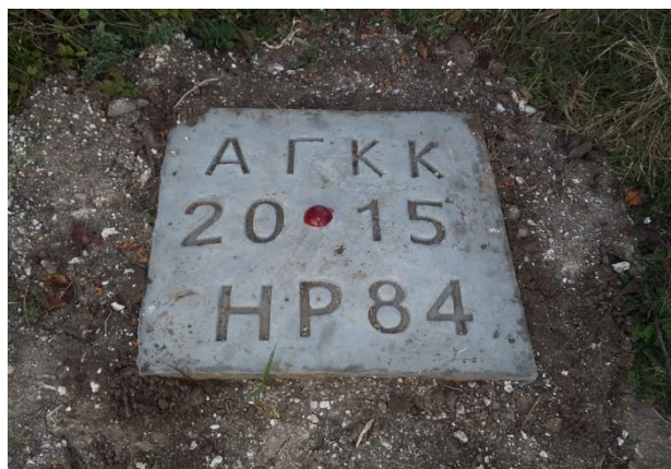
Фигура 8. Стабилизиран гъбовиден болт на терен