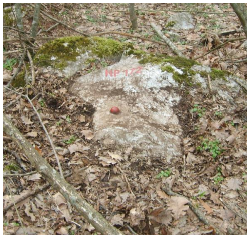
Фигура 9. Стабилизиране на гъбовиден болт в скала

При нивелачни репери в здрава скала около мястото, където ще се поставя гъбовидният болт, се изглажда повърхност (хоризонтална или вертикална) с размери 20x20 cm (фиг. 9). В средата на изгладената повърхност се пробива дупка с дълбочина 6.5 cm и диаметър 3.5 cm. Дупката се почиства и се промива с вода. Приготвя се разтвор от цимент и пресят пясък в отношение 1:1 и с него се запълва \frac{3}{4} от мократа дупка. Поставя се болтът и се натиска здраво към скалата. Излишъкът от циментов разтвор около стабилизирания гъбовиден болт се отстранява.