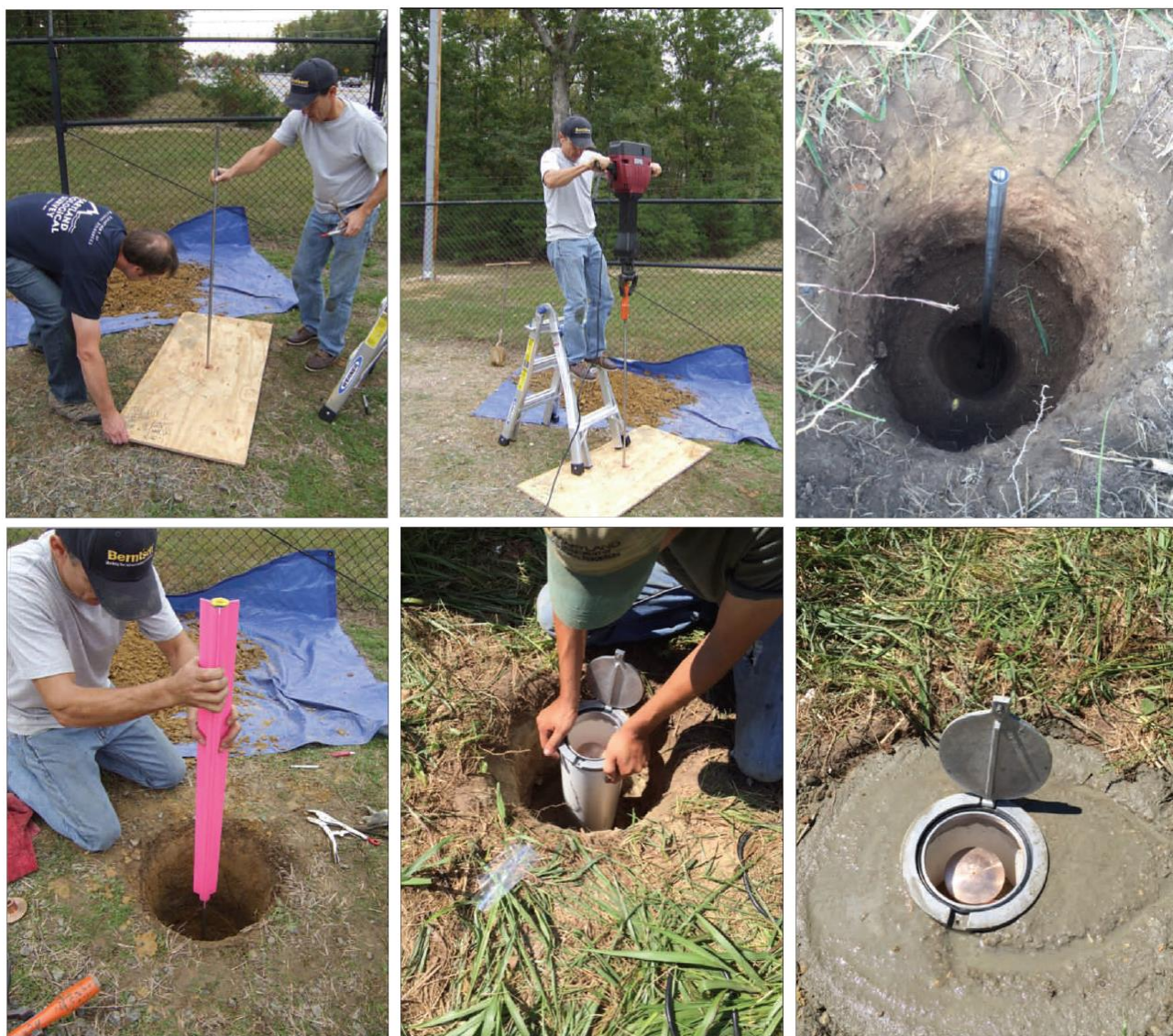
Фигура 2. Етапи от изграждане на дълбочинен репер

Етапи от изграждане на дълбочинен репер са дадени на фигура 2.