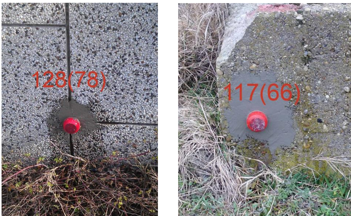
Фигура 5. Стабилизиране на болтове в сгради и съоръжения

Фигура 5 показва стенни болтове, стабилизирани в сграда и съоръжение.