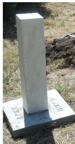
Фигура 3. Изработване на бетонов стълб на показалец към ВНР I и II степен